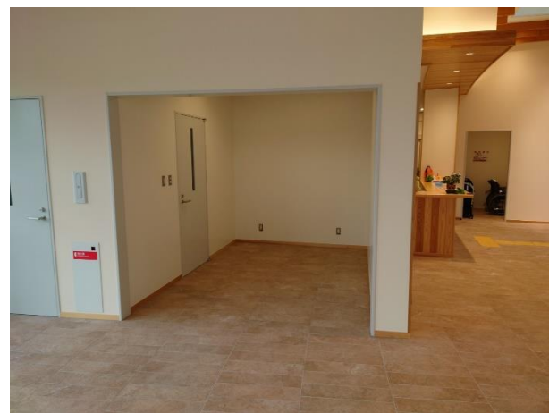
④飲食物販コーナー