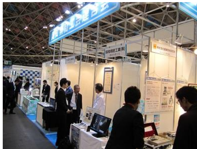
昨年の愛知県商工会連合会ブースの様子