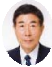
愛知県議会議員 石黒 栄一