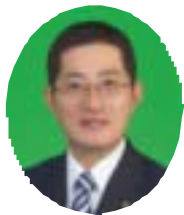
岩倉市長 片岡 恵一